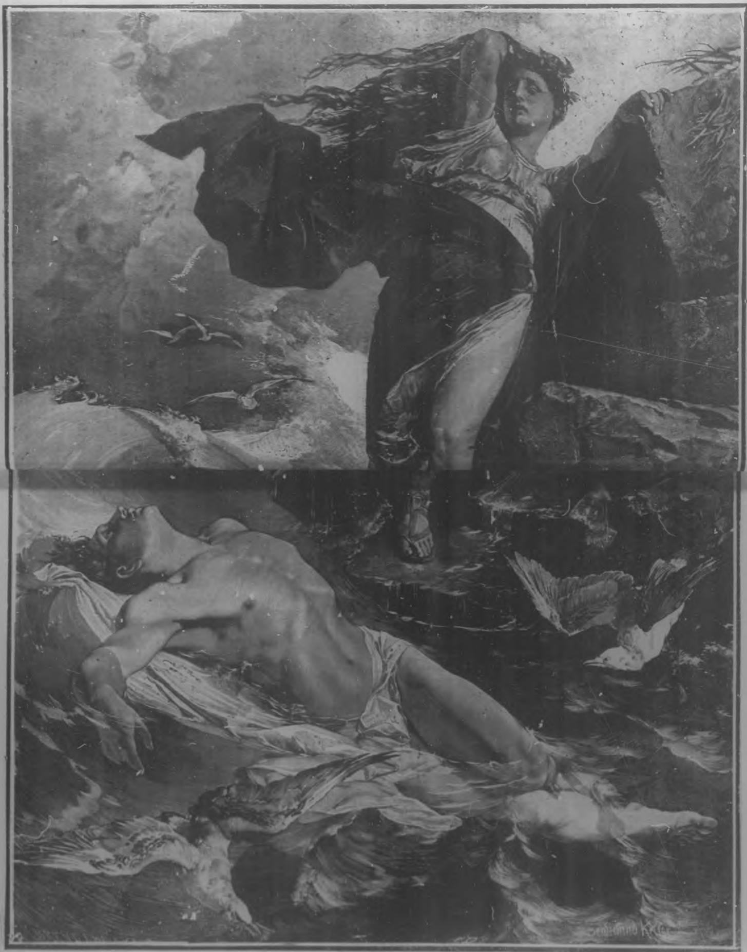
HERO Y LEANDRO, Cuadro de Fernando Keller.